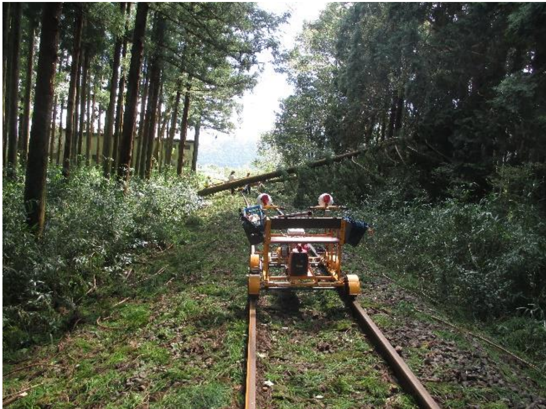
神海駅～高科駅間 倒木発生現場

9月4日 台風第21号接近に伴う暴風雨の影響により東大垣駅駅舎屋根破等、駅施設被害が7件 本巢車庫屋根破損等、技術部施設被害が2件 沿線での倒木が7件 倒木による通信ケーブル破損1件 暴風による遮断桿折損が5件の、合計22件発生しました。